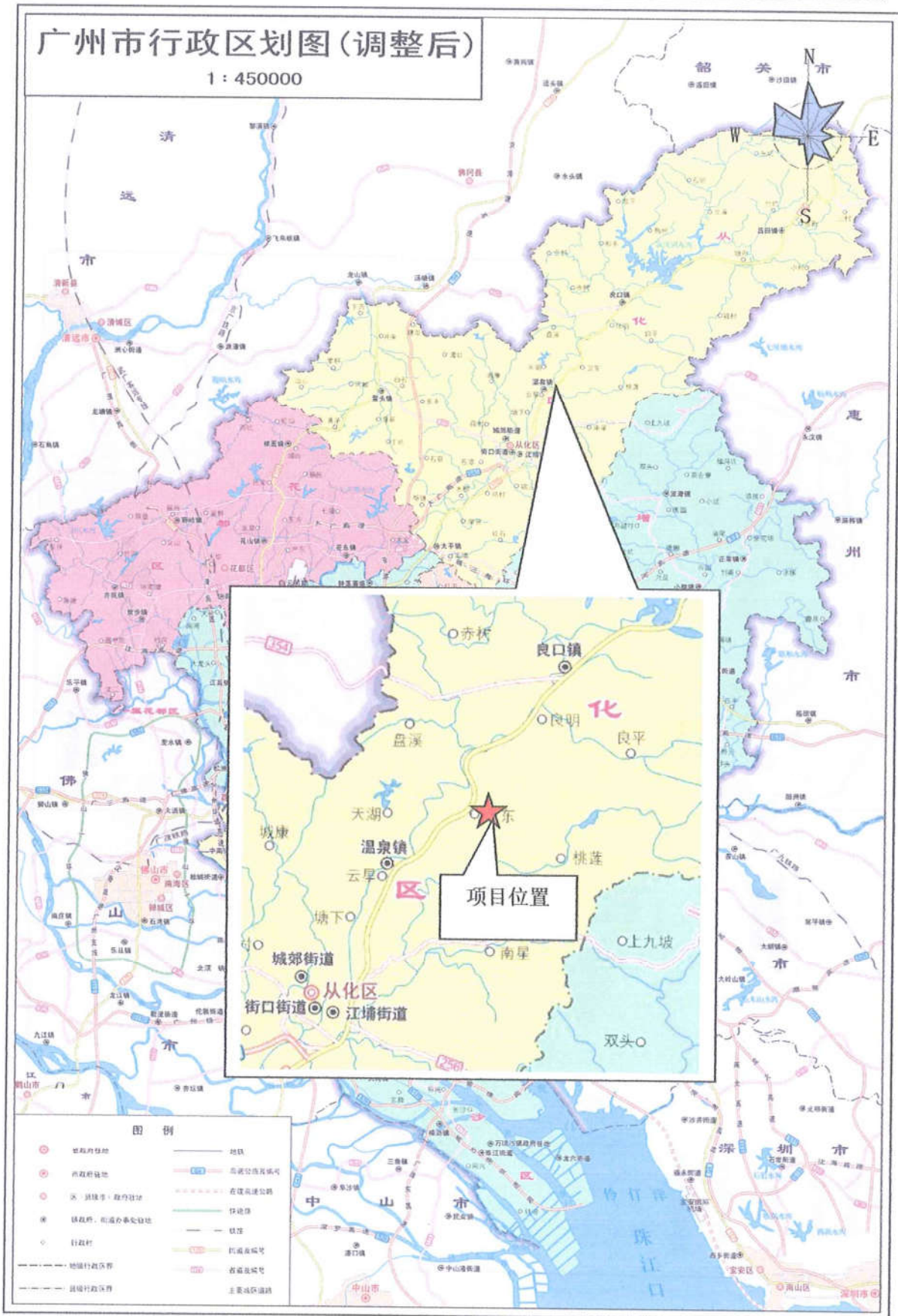
图 3-1 项目地理位置