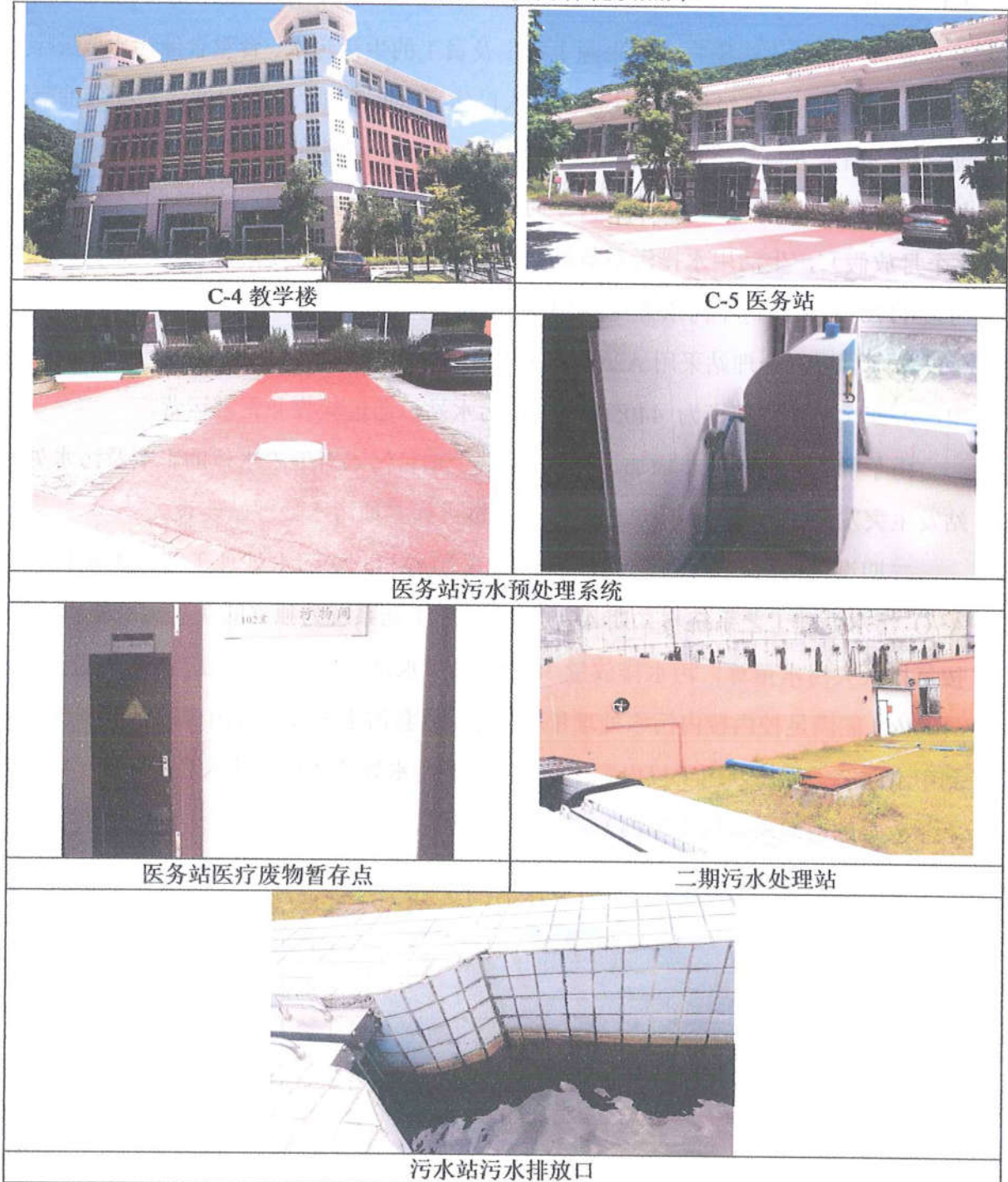
表 3-7 项目验收内容现状照片