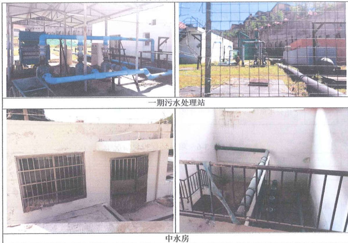
现有污水处理站照片